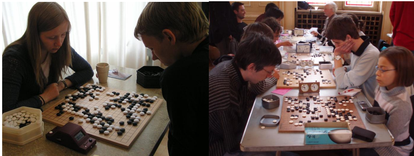
Jorge Luis Borges y el Go

“Hoy, 9 de septiembre de 1978, tuve en la palma de mi mano un pequeño disco de los trescientos sesenta y uno que se requieren para el juego astrológico del Go, ese otro ajedrez de Oriente. Es más antiguo que la más antigua escritura y el tablero es un mapa del universo. Sus variaciones negras y blancas agotarán el tiempo; en él pueden perderse los hombres como en el amor o en el día. Hoy, 9 de septiembre de 1978, yo, que soy ignorante de tantas cosas, sé que ignoro una más, y agradezco a mis númenes esta revelación de laberintos que ya no exploraré...”