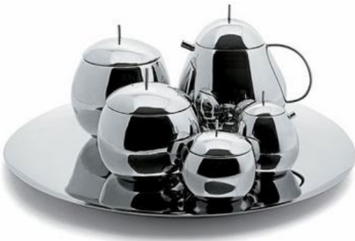
Juego de té y Fruit Basket SANAA 2003