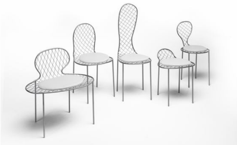
Family chair Junya Ishigami 2010