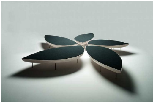
Konoha Sancal Toyo Ito 2011