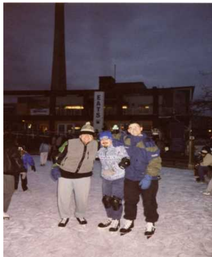
Patinando en Toronto

INSTITUTO ESPAÑOL DE COMERCIO EXTERIOR DIVISIÓN DE SERVICIOS A LA EMPRESA