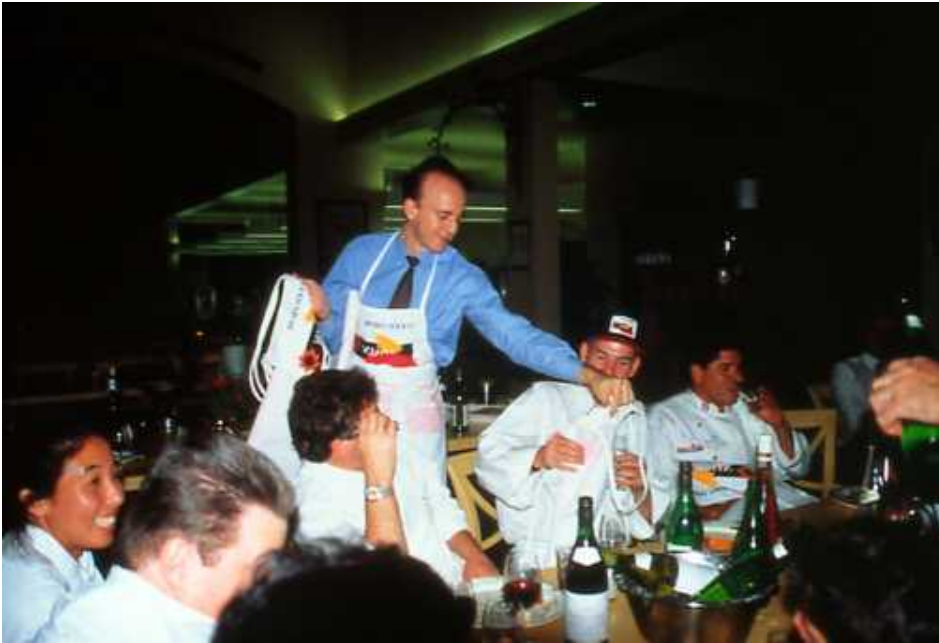
Feria de Vinos en Nueva York