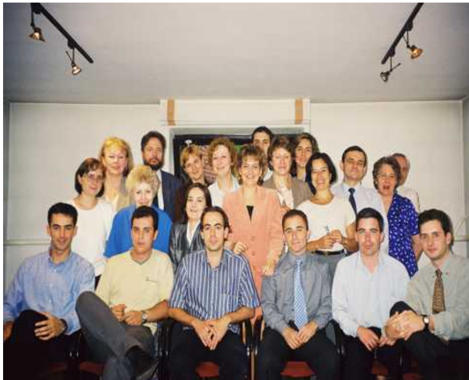
Oficina de Varsovia