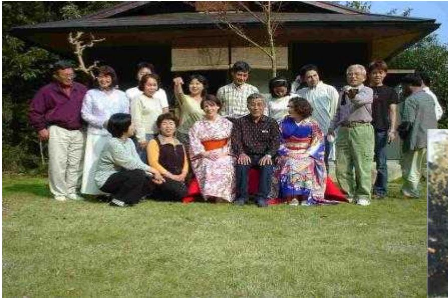
Becarios en Kimono en Japón