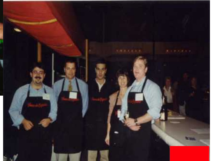
Feria de Vinos en Toronto