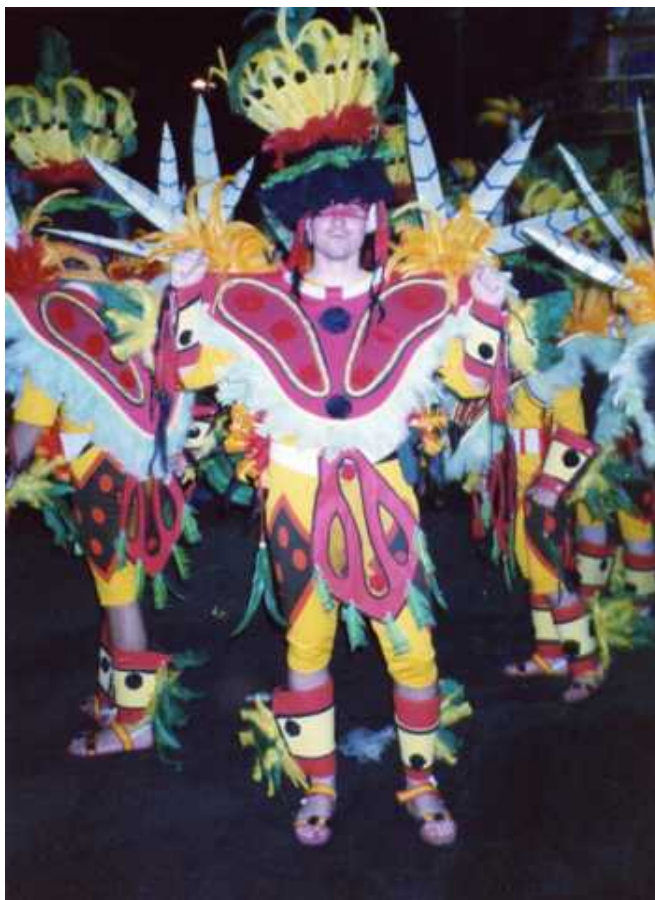
Carnavales en Río

INSTITUTO ESPAÑOL DE COMERCIO EXTERIOR DIVISIÓN DE SERVICIOS A LA EMPRESA