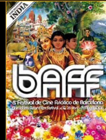
v बार्सेलोना में भारतीय पंजाबी दल