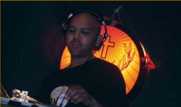
डीजे वी एशिया महोत्सव'07 में v

निर्माण में स्त्रियों की भूमिका पर केंद्रित था: निर्देशिकाओं के रूप में उनकी वचिारधारार्यें व भारतीय समाज में बदलाव लाने वाली मोटर के रूप में उनके प्रभाव। ऐसी फलिमें का प्रदर्शन हुआ जिन्होंने बॉलीवुड से अलग तरह का आनंद दिया, जैसे स्वतंत्र फलिमें या फरि तमलि व तेलुगु चलचित्रण।