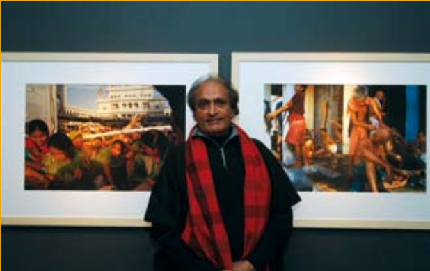
^ रघु राय