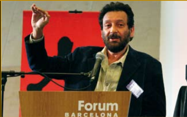
^ फलिम् नरिमाता शेखर कपूर