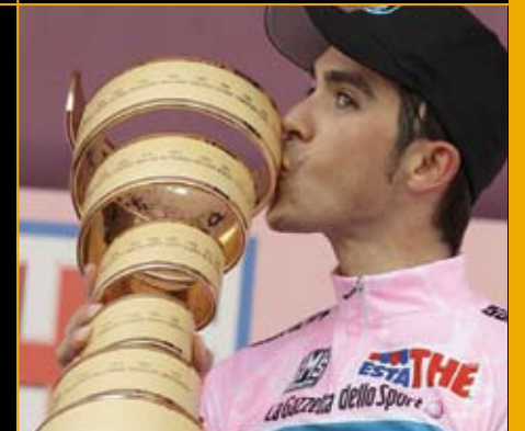
स्पेनी राष्ट्रीय फुटबाल दल