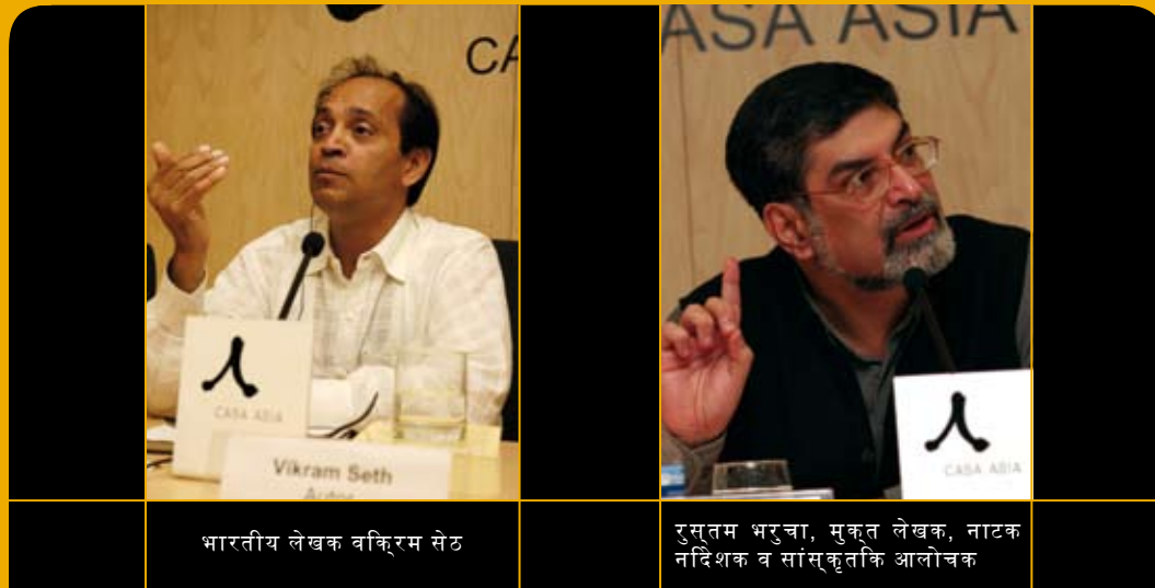
भारतीय लेखक विक्रम सेठ