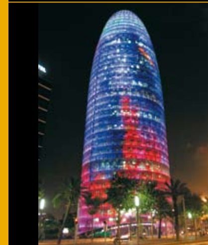
एगबार मीनार, बार्सेलोना