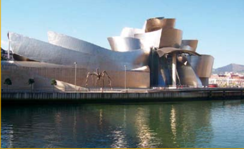
गगनहाइम संग्रहालय, बलिबाओ