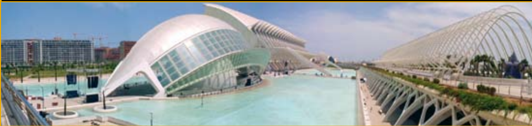
कला व विज्ञान नगर, वालेंसिया