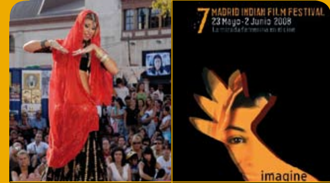
एशिया महोत्सव में भारतीय नृत्य प्रदर्शनी

एशिया महोत्सव FESTIVAL ASIA ASIA FESTIVAL