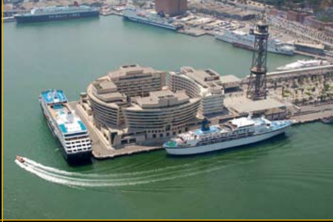
बार्सेलोना बंदरगाह व डब्ल्यू.टी.सी.(WTC)