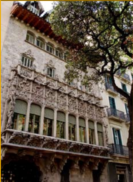
कासा एशिया, बार्सेलोना