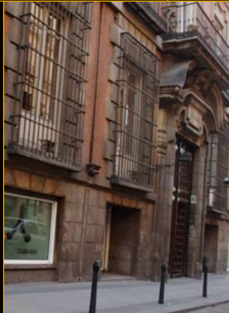
कासा एशिया-माद्रिद केंद्र