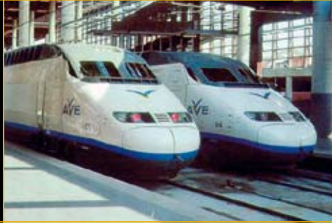
आवे (AVE), उच्च रफ़्तार ट्रेन