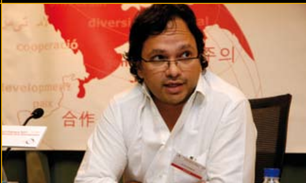
उपन्यासकार वकिरम चंद्रा v

में स्पेनी नविश को आगे बढ़ाने के लक्ष्य लयि बहुत सी द्वि-पक्षीय भेंटों में भाग लयि। इस यात्रा के भाग के रूप में मुंबई में कासा एशिया ने “भारत में स्पेन: संस्कृति व शक्तिषा” नामक एक कार्यक्रम भी पेश कयि, स्पेन में आयोजति उन गतविधियों व सांस्कृतिक आयोजनों का प्रचार करने के लयि जनिका संबंध भारत से होता है।