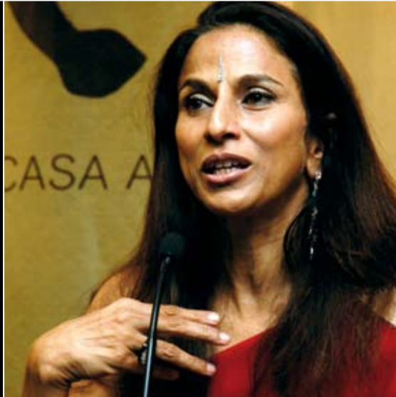
लेखिका शोभा डे