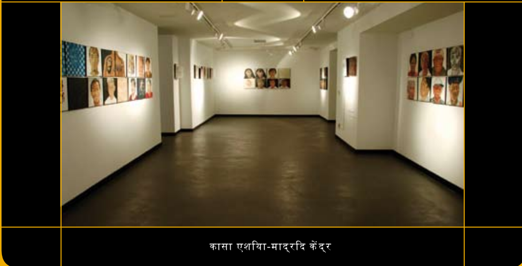
कासा एशिया-माद्रिद केंद्र

2007 में जब माद्रिद नगर नगिम कासा एशिया को प्रशासित करने वाले सार्वजनिक संकाय का हिस्सा बना, तब कासा एशिया का स्पेनी राजधानी में अपना स्थायी स्थान बनाया गया: मीराफ्लोरेस महल के अंदर स्थिति कासा एशिया-माद्रिद केंद्र। उस समय से शहर में इसकी गतिविधियों में बढ़ावा हुआ: उसके लेक्चर कमरों में कनफ्यूशियस इन्सटिट्यूट स्थापित करने के करार पर हस्ताक्षर हुये, साथ ही साथ हिंदी भाषा व बॉलीवुड व भरतनाट्यम नृत्य कक्षाएँ, गोष्ठियाँ पुस्तक-वमिचन, एशियाई फिलिम की श्रंखलाएँ, इमैजनि इंडिया फिलिम प्रदर्शन हुये, एक 110 वर्गमीटर के प्रदर्शनी-कक्ष स्थापित हुआ व “स्पेनी व्यापारों के भारत में अनुभव” जैसे कार्य-नाशते के आयोजन हुए। केंद्र में एक संचार-माध्यम लाइब्रेरी भी है, जो बार्सेलोना में स्थिति संचार माध्यम लाइब्रेरी को पूर्ण करती है।