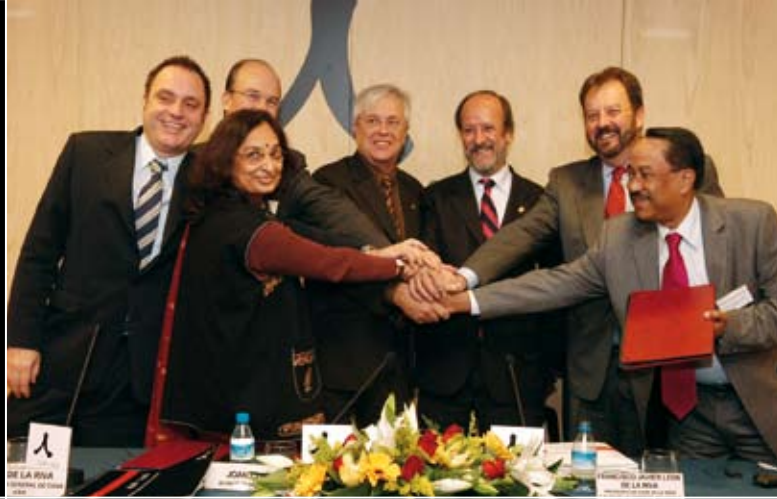
प्रथम स्पेन-भारत दूरबिज्ञान, 2005