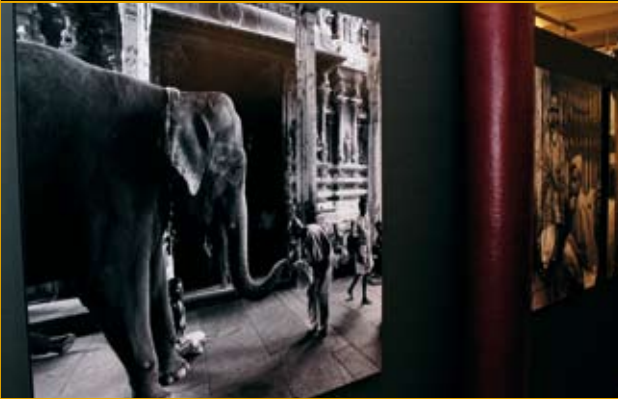
तरुण चोपड़ा की फोटो-प्रदर्शनी