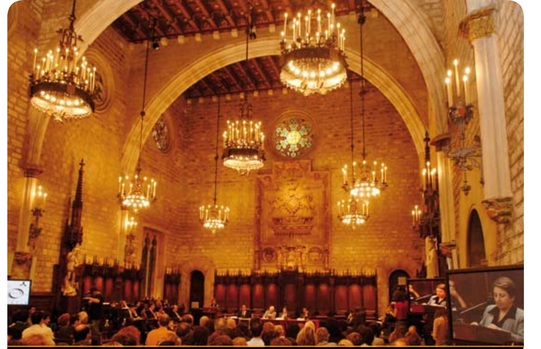
पूर्व-पश्चिम संवाद का उद्घाटन समारोह