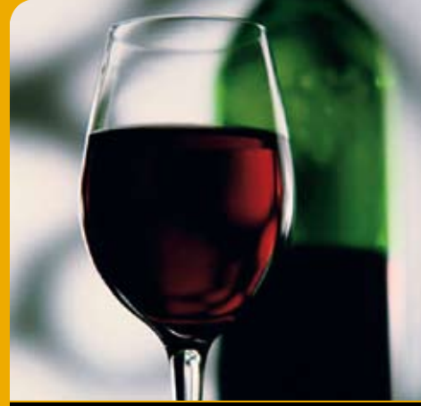
स्पेनी मदिरा (वाइन)