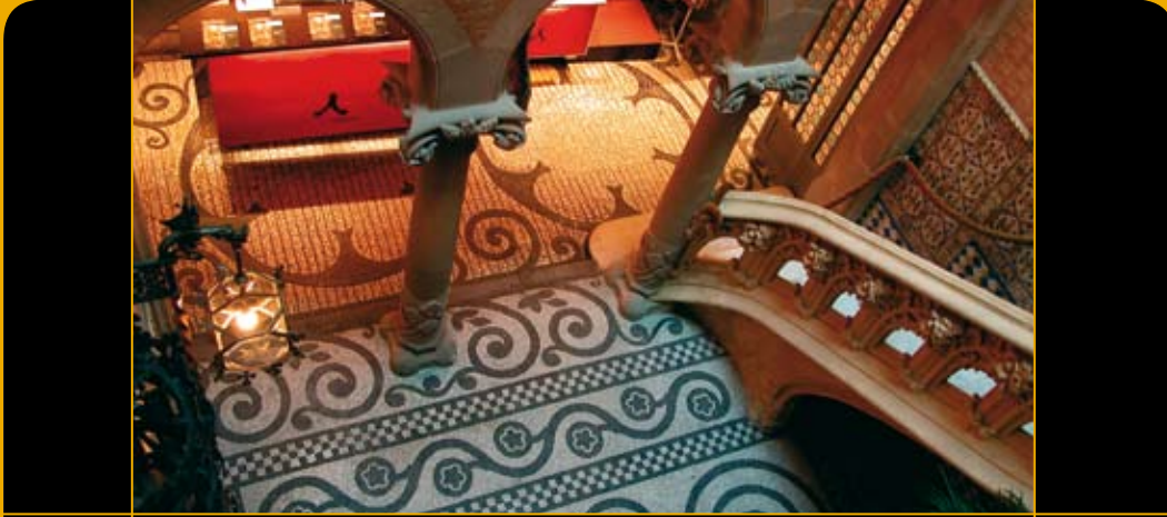
कासा एशिया, बार्सेलोना