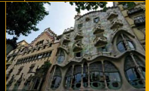
कासा आमेत्ल्येर व कासा बात्ल्यो, बार्सेलोना