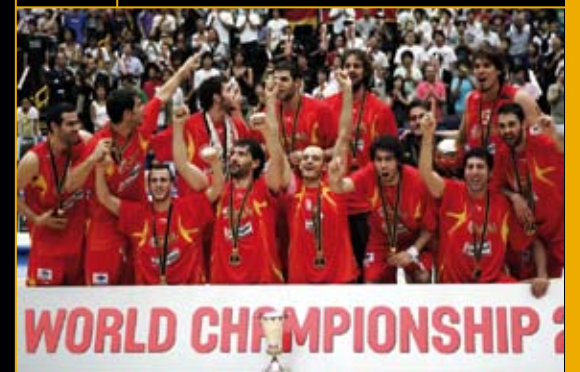
स्पेनी राष्ट्रीय बास्केटबाल दल