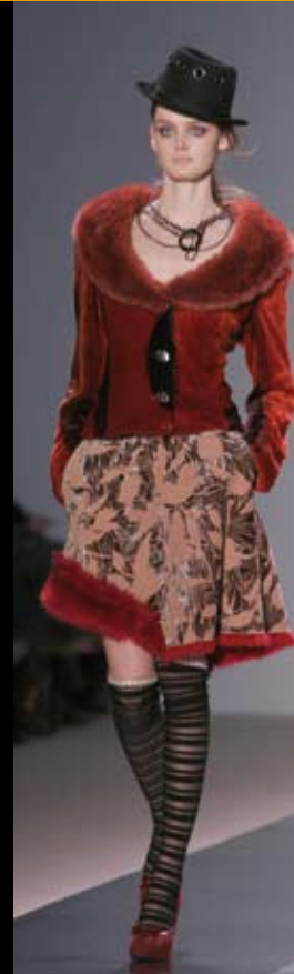
बार्सेलोना फैशन सप्ताह